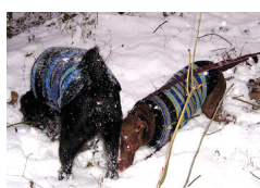
28. 12., 9. hlášení

(Malé doplnění a vysvětlení: Ráno jsem obvykle chodívala s oběma holkama sama na takový malý venčící okruh. Byla to obvykle spíš taková ta hra na Pletla kytku v rozmarýnku, pořád jsem vyplétala z vodítek nějaké tlapky či nohy, případně celé pejsky zamotané jako vánoční balíček, nebo také sebe – naštěstí mě nepřimotaly ke stromu jako to bylo v Jáchyme, hod' ho do stroje. Také jsem snažila naučit předvídat, kdy Abbie vyrazí za krásami světa, abych se včas přišpendlila k asfaltu, neboť ona má ukrutnou sílu. Ale ne vždy se mi to zadařilo, a když pak napadl sníh, podařilo se jí mě několikrát dostat na zem – to k velikému údivu milých chlupatic, které se mi následně snažily dát první pomoc, zejména pak umělé dýchání, a já jsem se tomu všemu tak smála, že jsem nebyla schopná se vymotat ze všech těch tlapek a vodítek a vstát.)